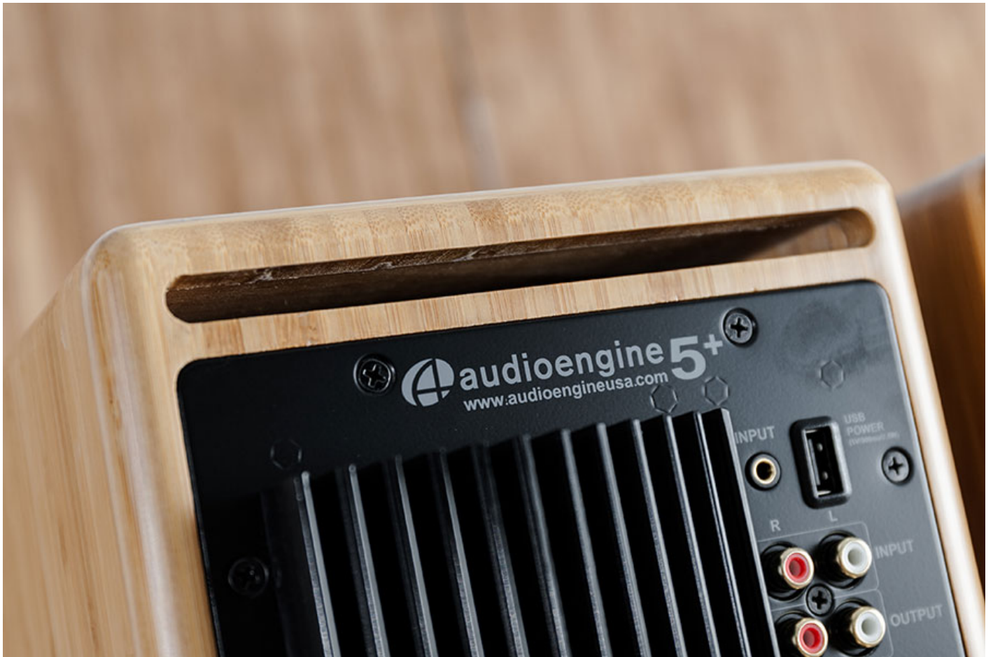
主喇叭設有散熱片設計，兩隻喇叭的音箱背面都有低音反射孔。