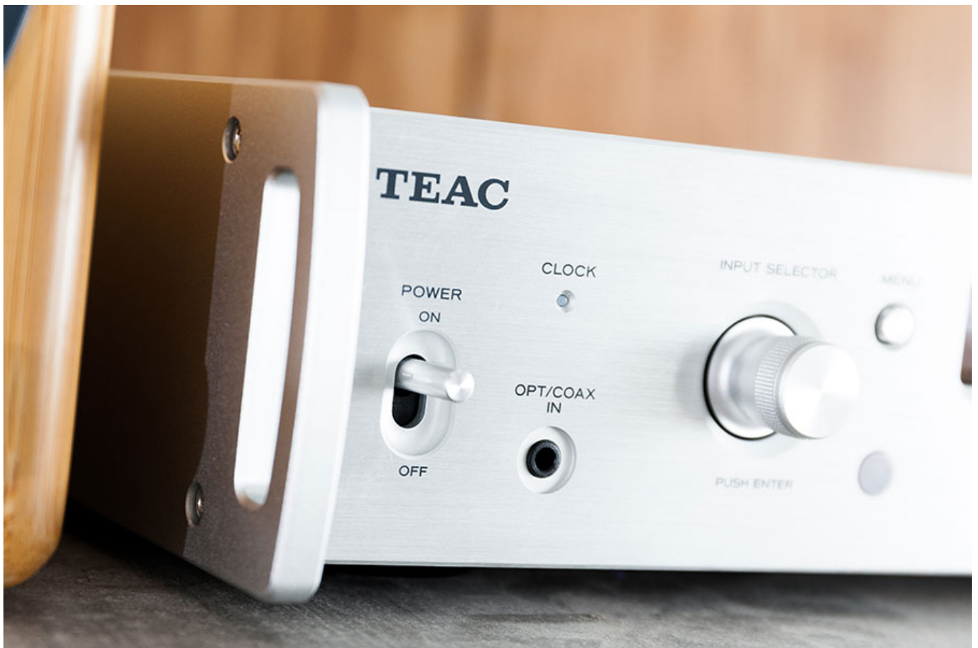
撥杆式開關、配合拉絲金屬面機身，設計相當有型。