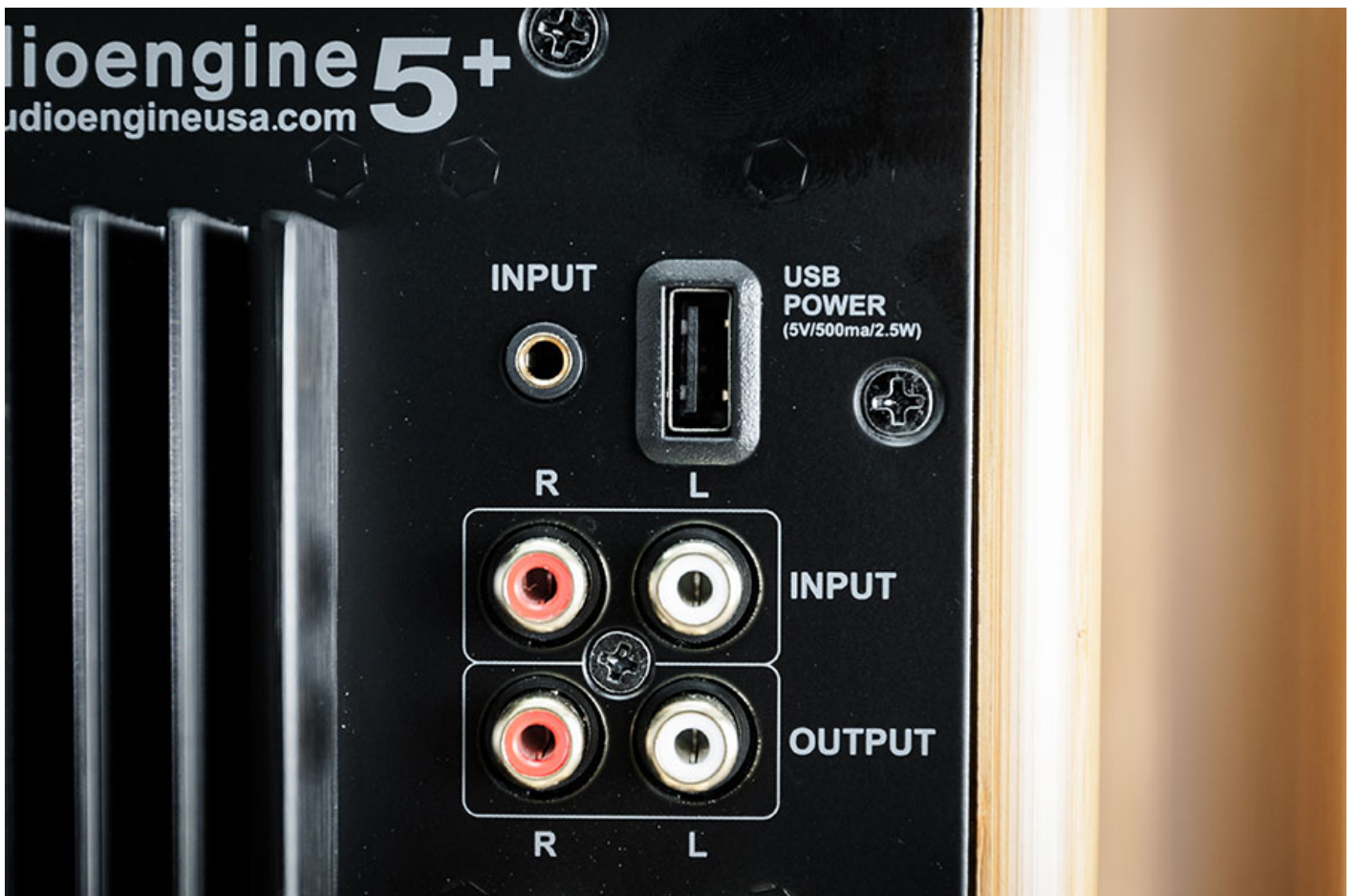
設有 RCA 以及 3.5mm audio 輸入，USB 可用作供電。