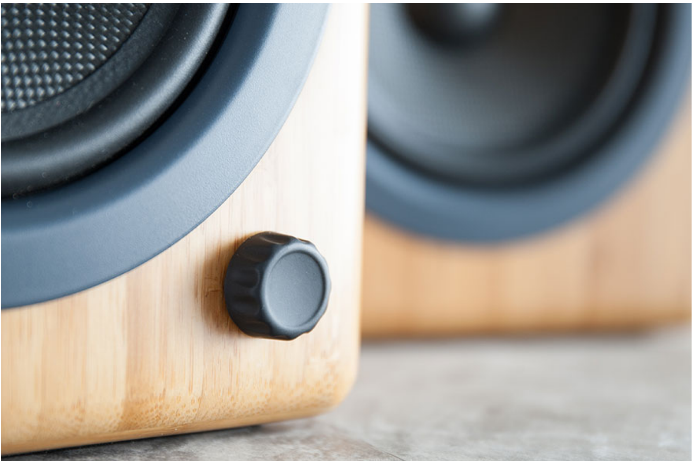
前置旋鈕控制音量，同時調節左、右聲道，使用上更方便。