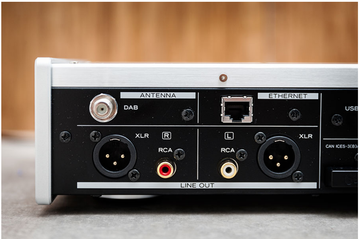
平衡電路設計，設有 RCA 及 XLR 端子。