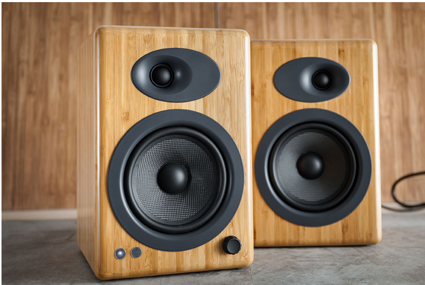
TEAC NT-503DAB 加配竹紋 Audioengine A5+ 的「套裝價」是 $9,580、配黑色 A5+ 平些少，只需 $9,070。

A5+ 是 Audioengine 的中價主動式喇叭，今次配套 TEAC NT-503DAB 有優惠的包括竹紋以及緞黑音箱兩種選擇，規格就相同，竹紋版貴些少。採用了 3/4 吋絲膜球頂高音、5 吋 Kevlar 低音單元，1/2 吋的 MDF 夾板箱體。左邊是主喇叭，背面設有 RCA 以及 3.5mm line-in 鍍金端子，USB 端子就可以用來幫手機充電。右邊的副喇叭就由主喇叭驅動，2.0 聲道總輸出可達 150W，對於房間、甚至客廳使用都算足夠。