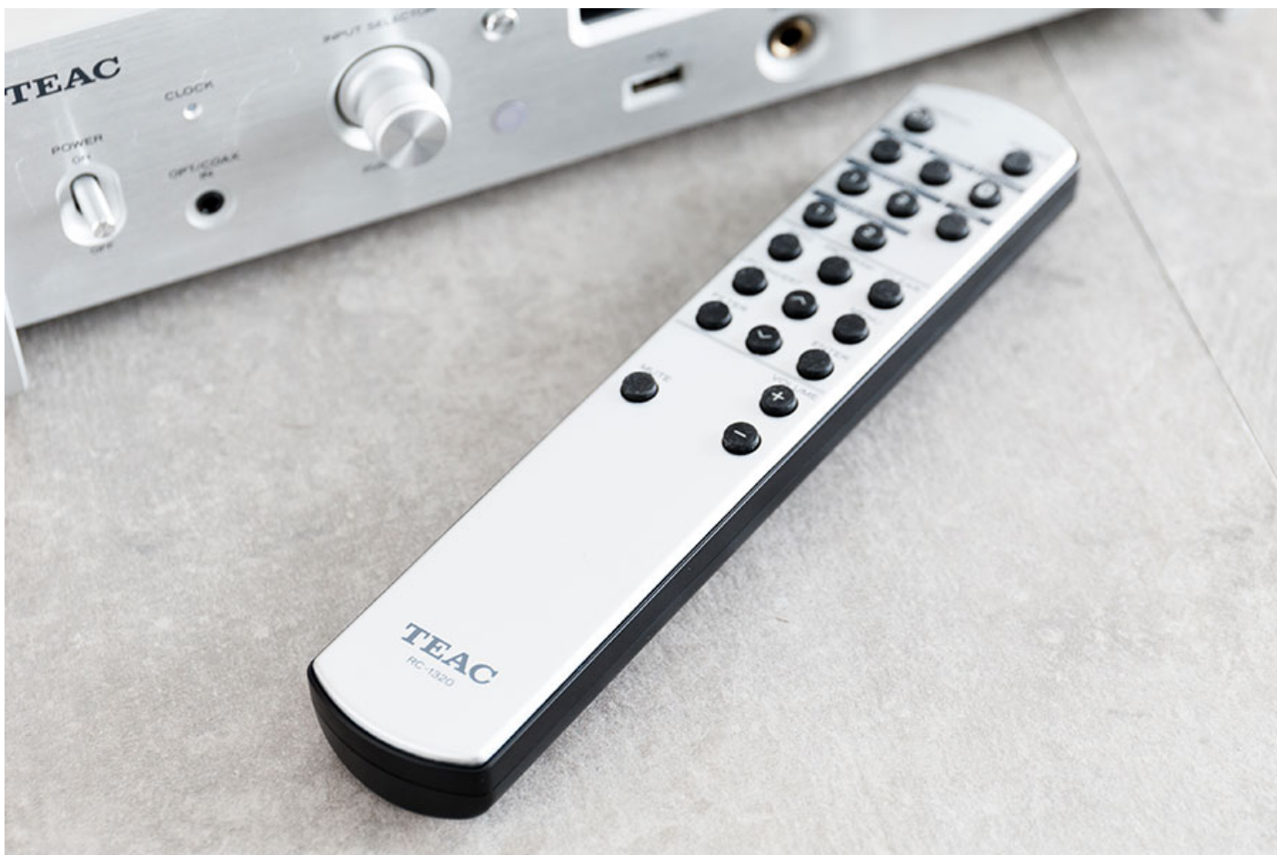
附送全功能遙控，無論設定或者音樂播放控制都更方便。