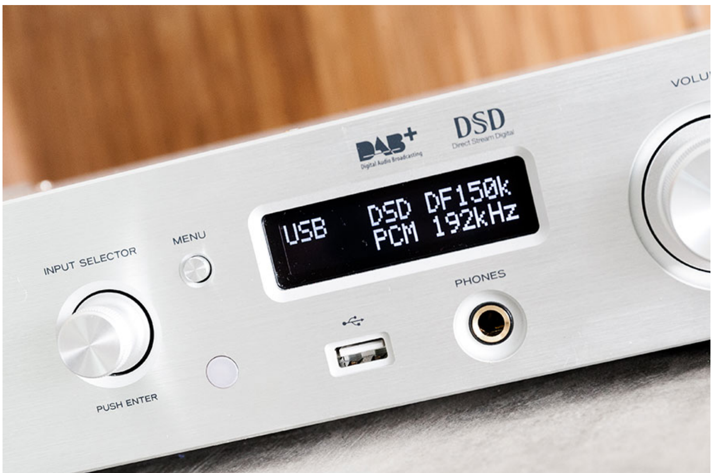
前面板的顯示屏資訊幾清晰，設有前置 USB，內置獨立耳擴以及 6.3mm 耳機輸出。