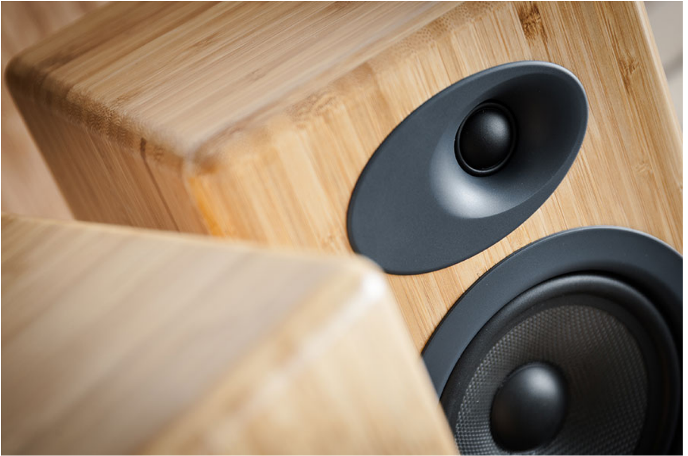
A5+ 配備了 3/4 吋絲膜球頂高音、5 吋 Kevlar 低音單元。