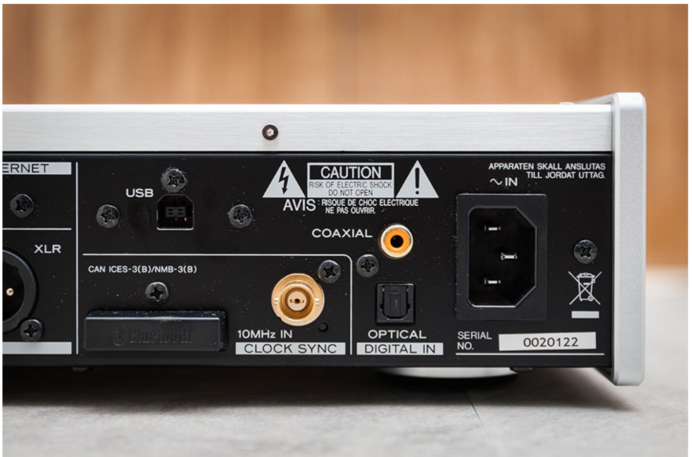
除了作為 USB DAC 之外，也支援光纖及同軸輸入。