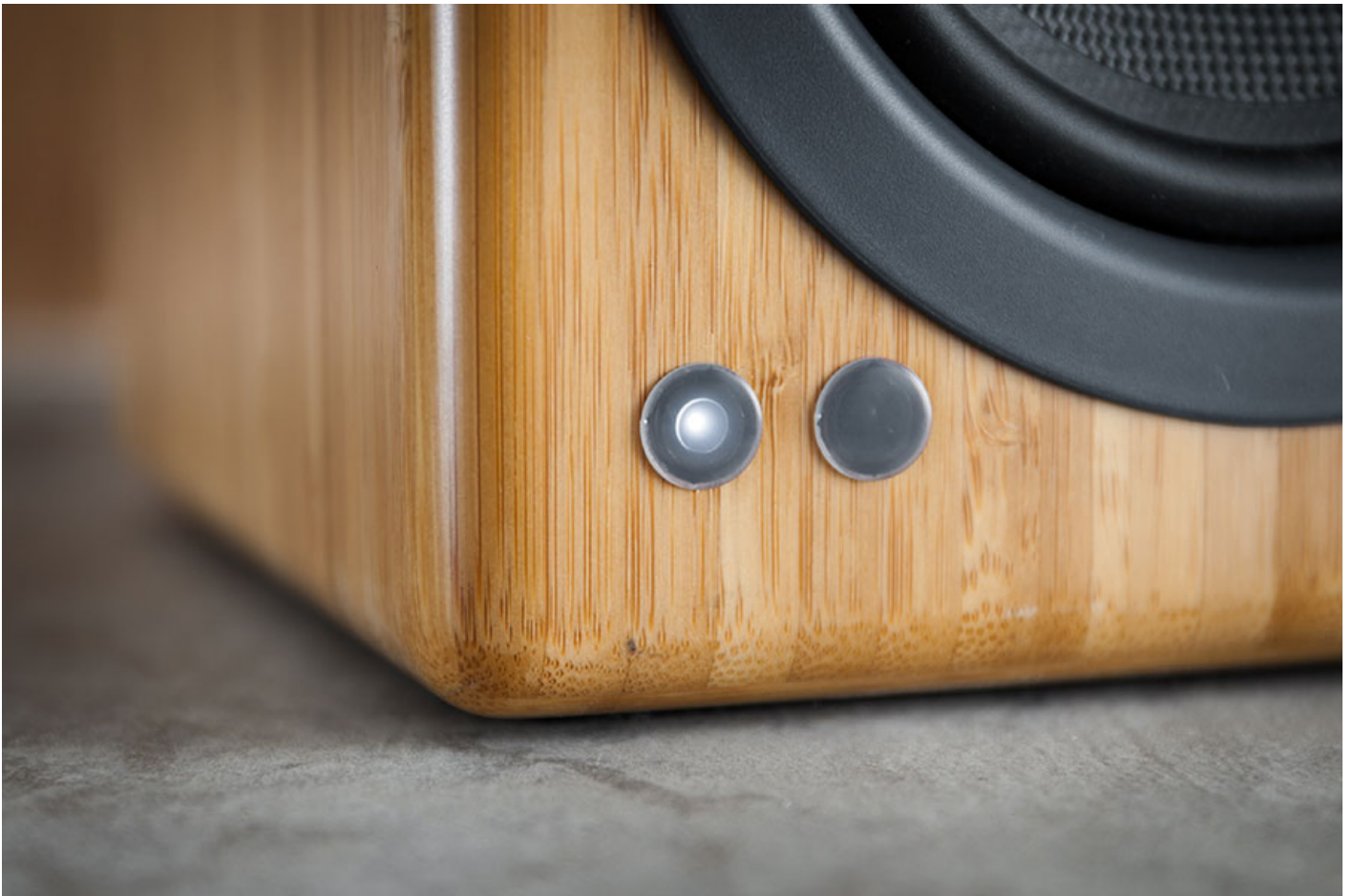
左邊的主喇叭有開關指示燈。