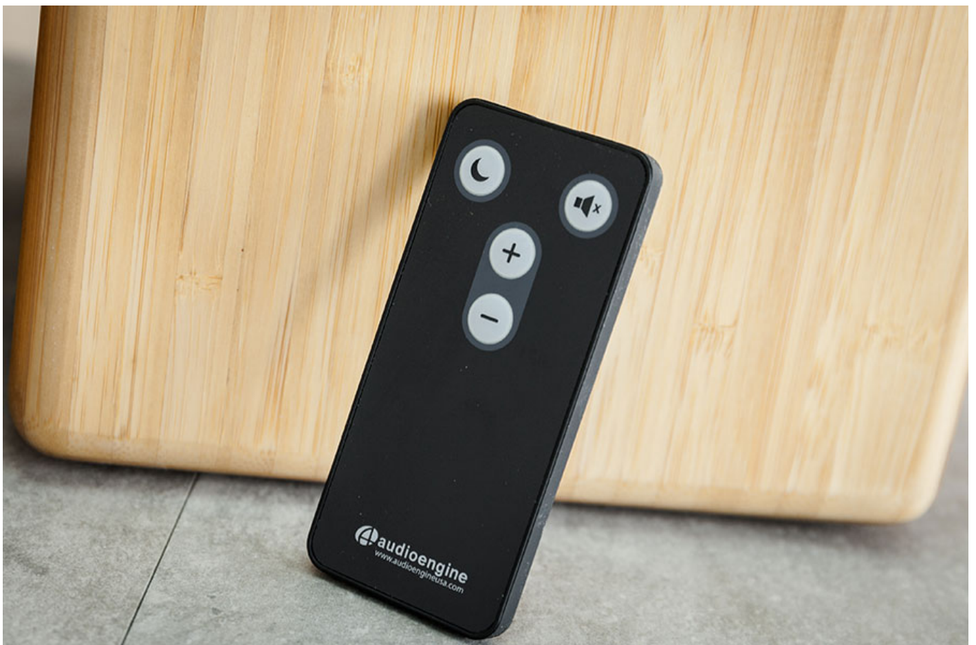
附送一個小巧遙控，可調校音量、靜音及休眠。